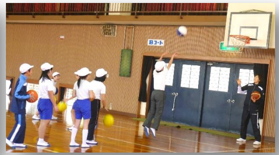
バスケットボール教室6年