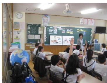
キッズ サロ - トスクール(5年)