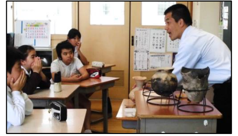
6年 埋蔵文化財出前授業