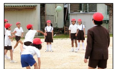
3, 5年 わくわくタイム