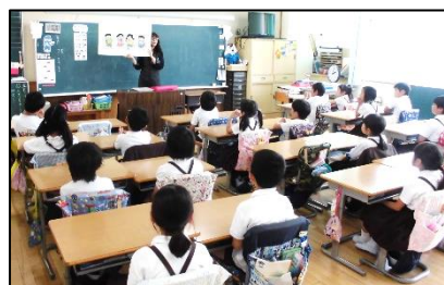
2年 キッズサポート教室